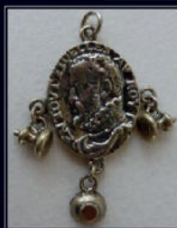
Antieke sieraden & Streekdrachtsieraden