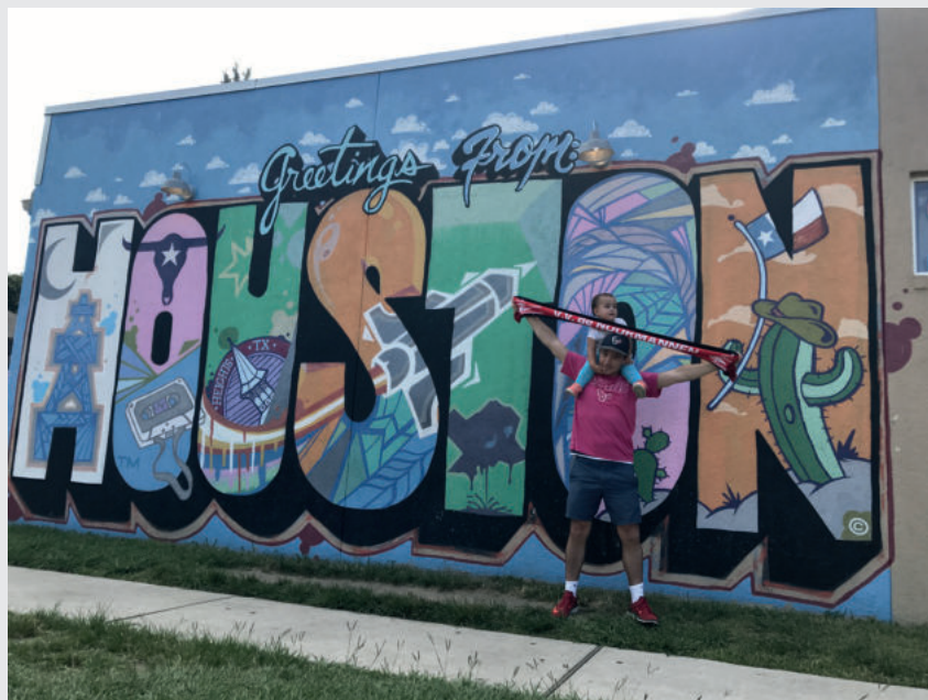
“The stars at night, are big and bright... Deep in the heart of Texas The prairie sky is wide and high... Deep in the heart of Texas”